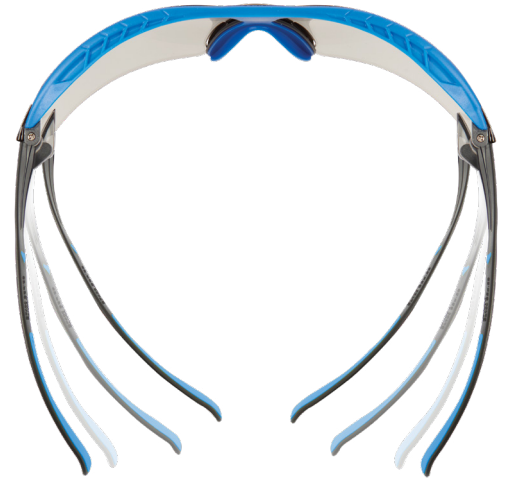
Tecnología de Difusión de Presión de 3M™.